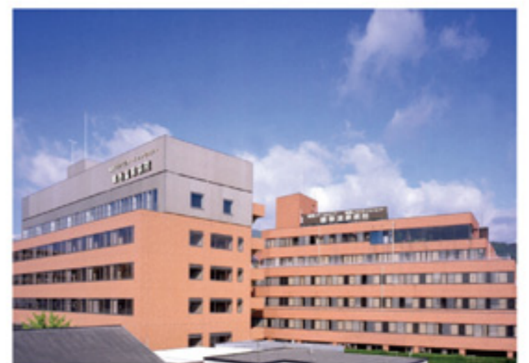
鶴巻温泉病院 全景