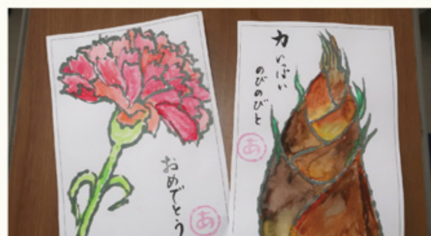
リハビリテーション部