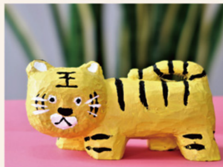
干支の寅（木彫り 作者 左龍太郎）

コロナ禍が続き、ウイルスは変化し、オミクロン株が猛威を奮っています。国や県の基準や行動制限も毎日のように変化し、私たちも変化する情報に合わせて対策を変更しながら職員に周知しています。コロナ禍に関しては、私は常々「朝礼暮改」が良いと言っています。未知のウイルスはどうなるか予測ができないので、その時その時に得られるエビデンスをもとにBESTの対応を迅速に行うことが必要だと考えているからです。そうすると昨日言ったことが、今日違うということも生じます。朝礼暮改と言われても構いません。英語で言えばagile（アジャイル）な対応と言えいいかもしれません。聞き慣れない言葉ですが、英語では「素早い」とか「機敏な」という意味です。